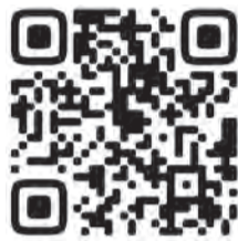
График их работы можно найти на сайте администрации города.

Напомним, что тренеры по месту жительства проводят занятия во всех районах Самары.