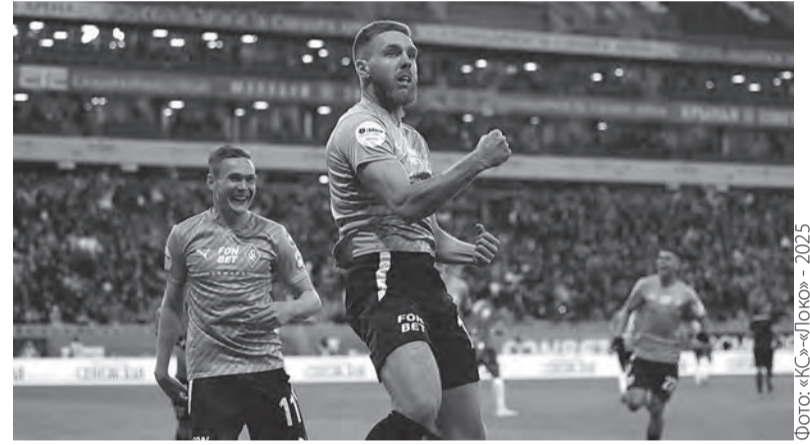
Фото: «КС»-«Локо» - 2025