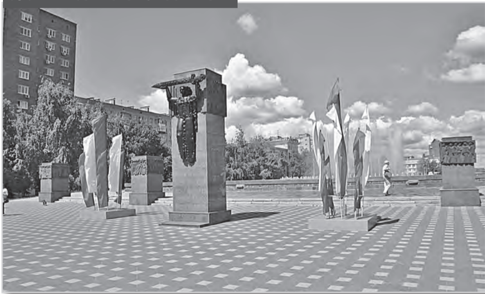
Площадь Героев 21-й армии в Самаре

В Приволжском военном округе происходило формирование полков, дивизий и даже армии - 21-й. Самым первым воинским отрядом, отправившимся на фронт из Куйбышева, была 117-я стрелковая дивизия, вошедшая в состав 21-й армии.