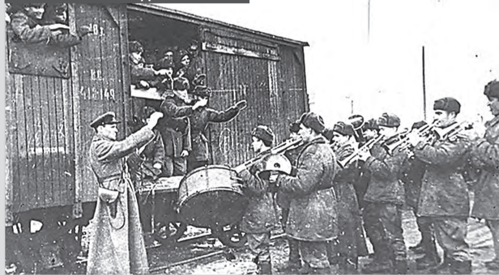
Отправка эшелона на фронт из Сызрани. 1941 год.

Формирование 117-й стрелковой дивизии началось осенью 1939 года в соответствии с указом Президиума Верховного Совета СССР от 15 августа о формировании и развертывании новых дополнительных дивизий РККА. Развертывалась в Приволжском военном округе в Куйбышеве. Штаб дивизии размещался в доме №4 на Красноармейской улице. Перед самой войной, в середине июня 1941 года, дивизия была срочно передислоцирована на Украину. Некоторые части - в Бровары под Киевом. Остальные - в Чернигов, где