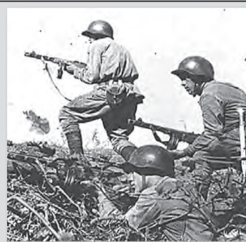
группировкой противника. Освобождали Смоленск, Оршу, Выборг и Прагу. С 2008 года одна из площадей Самары носит имя Героев 21-й армии.

21-я армия была сформирована в июне 1941 года на базе управления и войск Приволжского военного округа. Принимала участие в боях за Смоленск и Киев в 1941 году, сражалась под Харьковом в 1942-м, участвовала в Сталинградской битве. В апреле 1943 года за мужество и героизм личного состава 21-я армия была преобразована в 6-ю гвардейскую армию. В 1944-1945 годах бойцы 6-й гвардейской армии участвовали в освобождении Прибалтики. Вели бои с курляндской