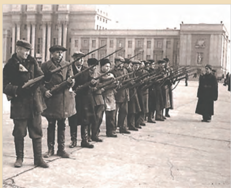
Занятия группы Всевобуча на площади имени Куйбышева. Октябрь 1941 г.

Всеобщее военное обучение граждан (Всевобуч) появилось в нашей стране в годы Гражданской войны и перестало существовать с ее окончанием.