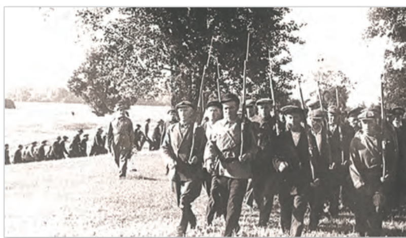
Ополчение Фрунзенского района г. Куйбышева на военно-тактических занятиях за рекой Волгой. 5 августа 1941 г. СОГАСПИ. Ф. 651 Оп. 12 Д. 1266

Показательны сообщения с мест. Например: «В Куйбышевском трампарке начато формирование роты народного ополчения. В первый же день из 1374 работающих на предприятии в ополчение вступил 81 человек».