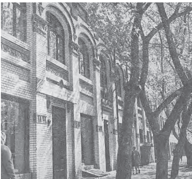
В этом здании зародилась швейная мастерская №2