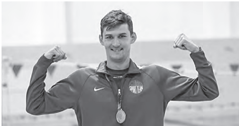
Победное завершение сезона

Сборная Самарской области заняла пятое место в смешанной комбинированной эстафете 4x50 м