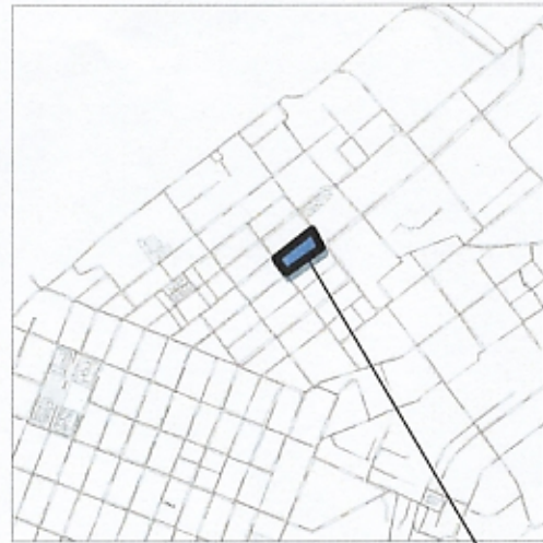
границы запрашиваемой территории