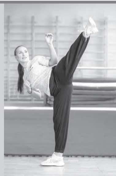
тольяттинской школы №71. Четверокурсница Тольяттинского экономико-технологического колледжа. Хобби - карате.

марского государственного социально-педагогического университета. У нас там учатся почти все ребята.