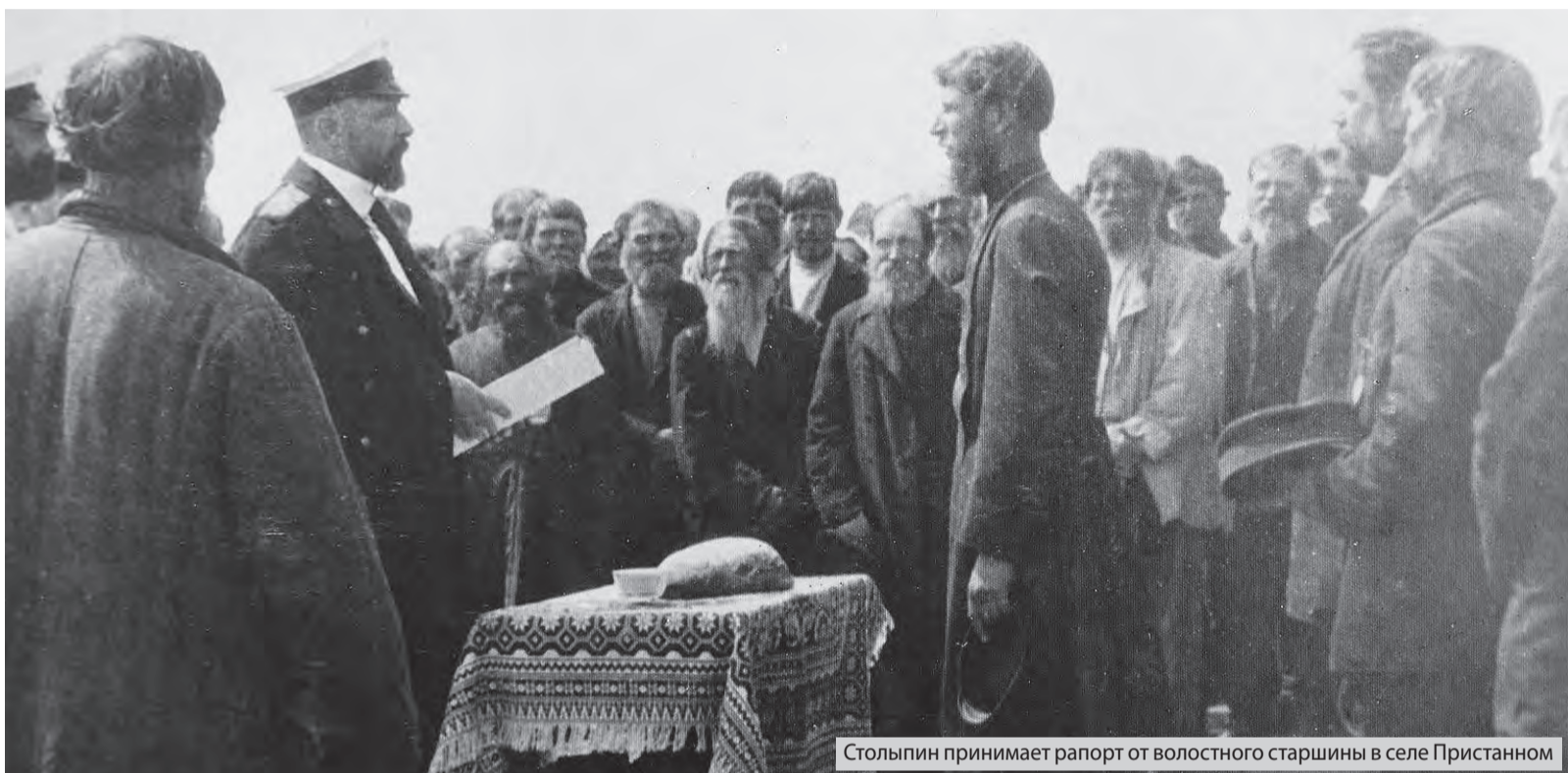
Столыпин принимает рапорт от волостного старшины в селе Пристанном

Безусловно, Столыпин-помещик отличался от многих владельцев имений: это был образованный, высокоэрудированный хозяин земли, хорошо разбирающийся в сложных проблемах не только собственного хозяйства, но и всего земледельческого производства России. Здесь в полной мере сказались университетское образование, знание трудов русских экономистов-аграрников, глубокое проникновение в хозяйственную жизнь русской деревни, анализ состояния дел в сельском хозяйстве Пруссии. Все это помогало Столыпину видеть проблему в целом, на-