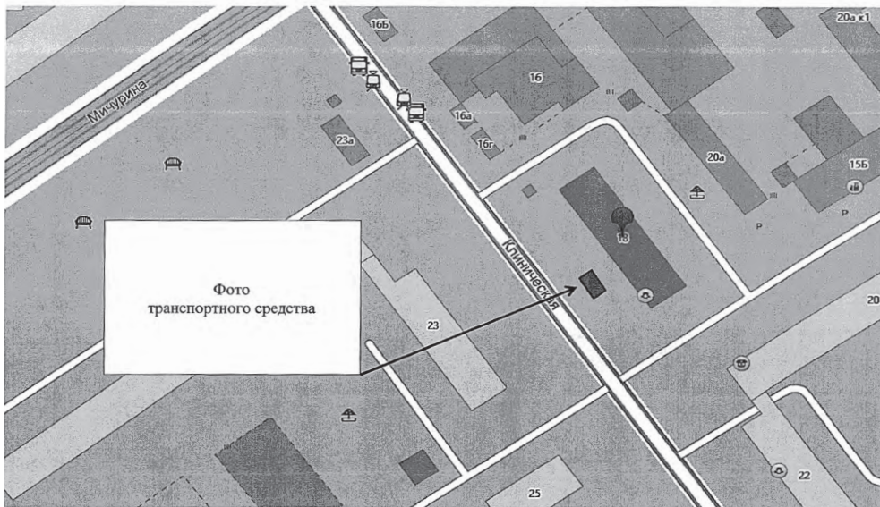
Схема парковки автомобиля марки _____ г/н _____ по адресу _____

Приложение № 2 к Положению о порядке выявления, учета, транспортировки и хранения брошенных, бесхозных ТС на территории Ленинского внутригородского района городского округа Самара с целью их дальнейшей утилизации или реализации