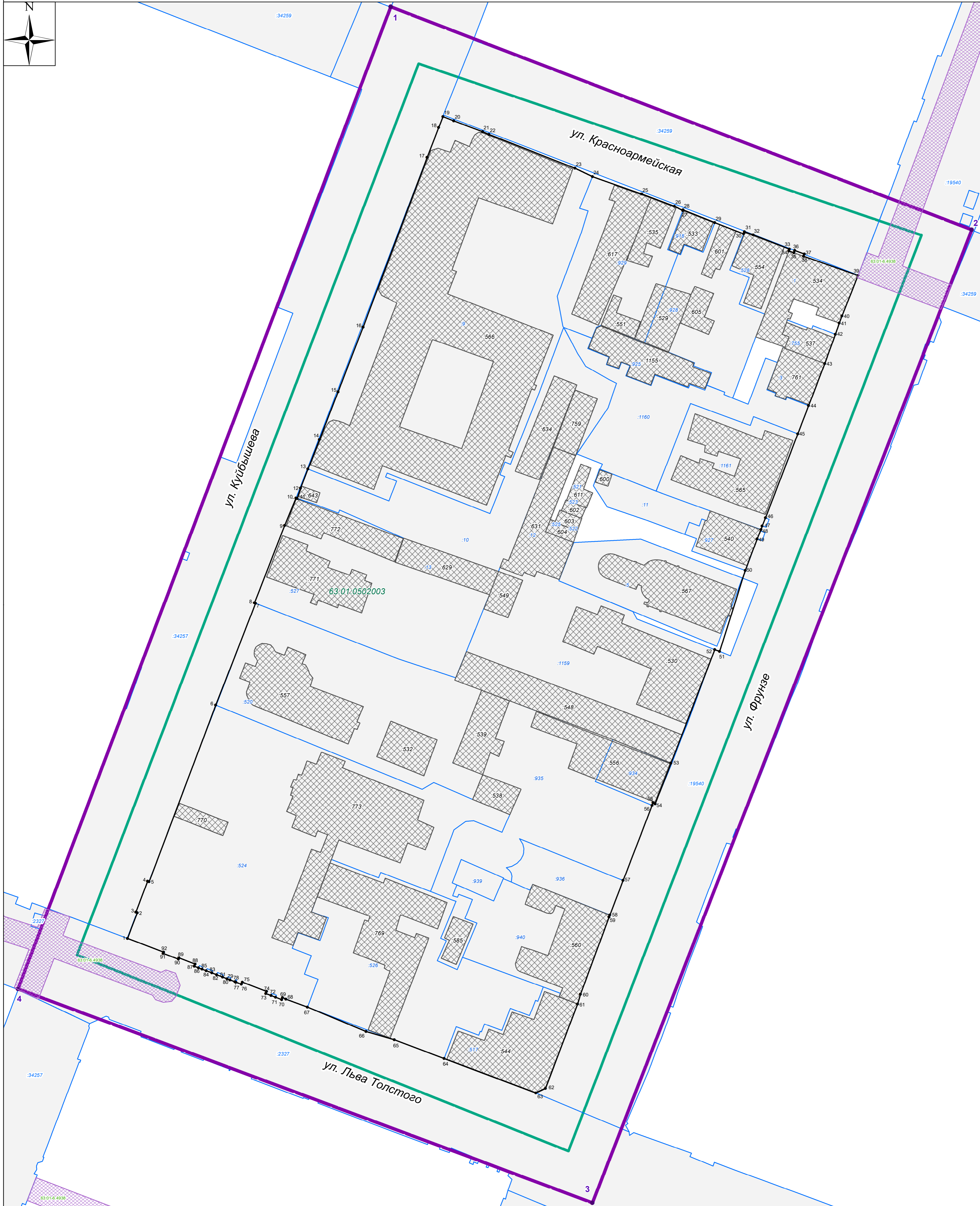
Схема расположения существующих элементов планировочной структуры