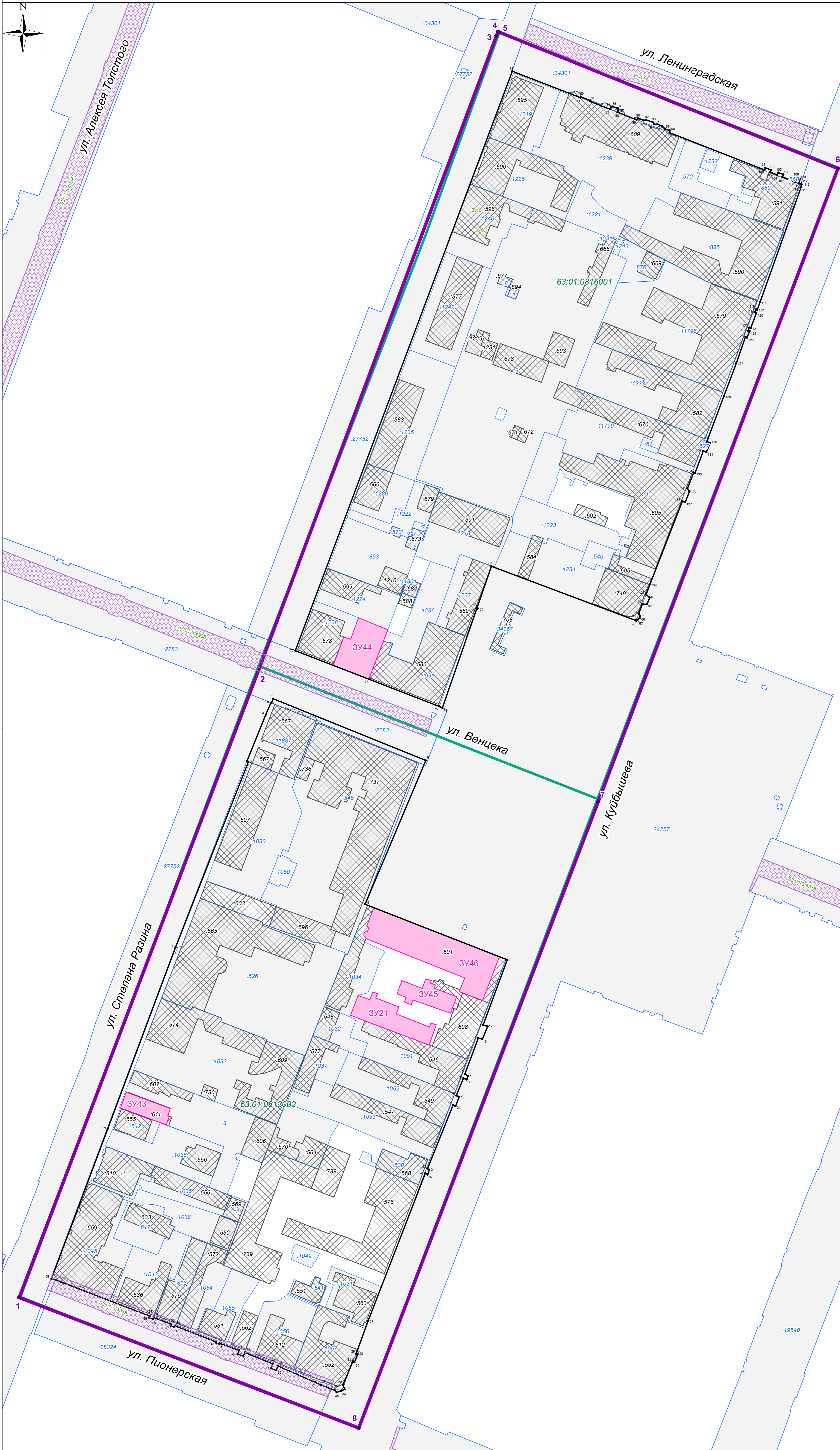
Схема расположения существующих элементов планировочной структуры