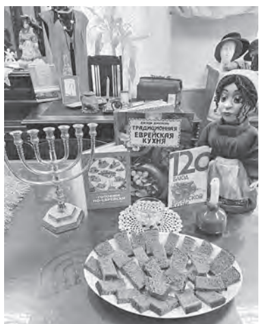
Музей еврейской культуры и быта конца XIX - начала XX века работает: вторник, среда, четверг и воскресенье - с 11 до 18 часов. Предварительная запись в группе вконтакте.

- Я обычная светская дама, но есть моменты, имеющие связь с