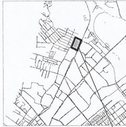
_____ границы испрашиваемой территории

Руководитель Департамента градостроительства городского округа Самара