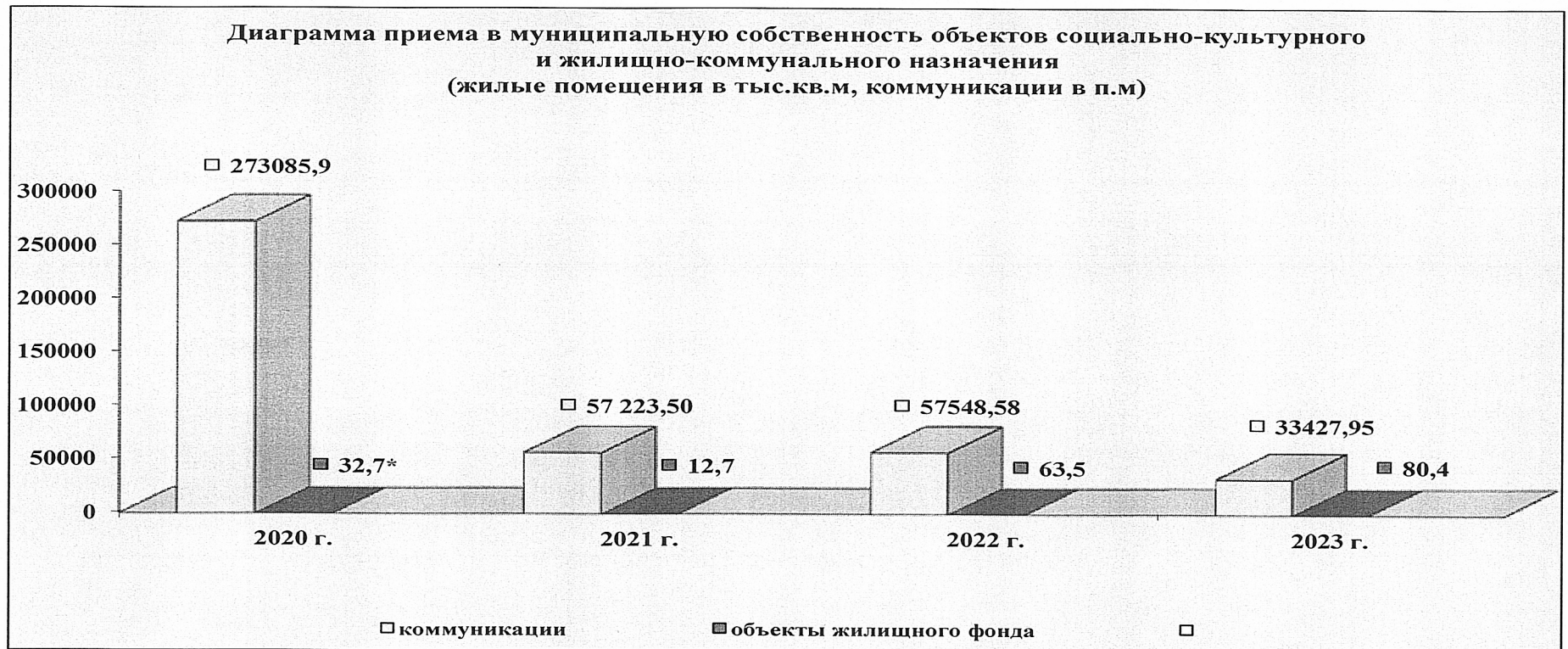
Диаграмма приема в муниципальную собственность объектов социально-культурного назначения и жилищно-коммунального хозяйства.

*в показателе диаграммы отчета за 2020 год допущена техническая ошибка