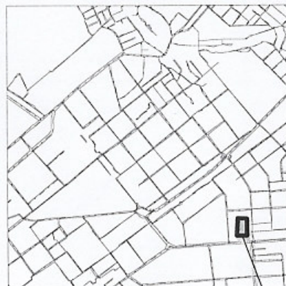
границы испрашиваемой территории

Руководитель Департамента Градостроительства городского округа Самара