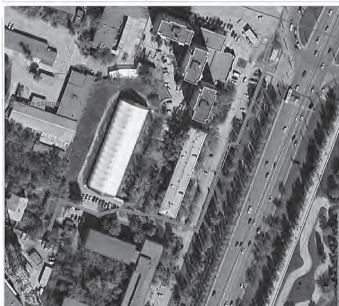
Схема границ публичного сервитута Объект: «Реконструкция ул.22 Партсъезда от ул. Солнечной до пр. Кирова, 1-я очередь (от ул. Солнечной до Московского шоссе) и 2-я очередь (от пр. Карла Маркса до ул. Ставропольская)», 1-я очередь (от ул. Солнечной до Московского шоссе)» Цель установления сервитута: Прокладка питающего электрического кабеля от ТП1713 до ШР1 Местоположение: Самарская область, г. Самара, Московское шоссе/ ул. 22 Партсъезда Площадь зоны публичного сервитута: 633 кв.м. Система координат: МСК-63 зона 1