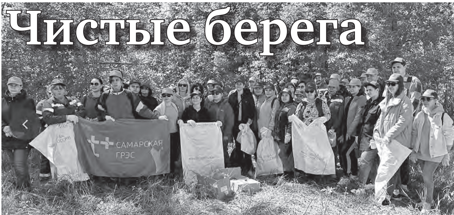
Энергетики поддержали Всероссийскую экологическую акцию «День Волги»

Акция «День Волги» является частью ESG-повестки компании, предусматривающей бережное отношение к экологии и снижение воздействия производства на окружающую среду. В рамках этой работы энергетики