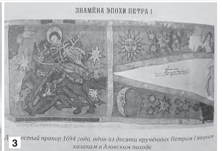
3. Двухзвостый прапор 1694 года, один из десяти врученных Петром I яицким казакам в Азовском походе