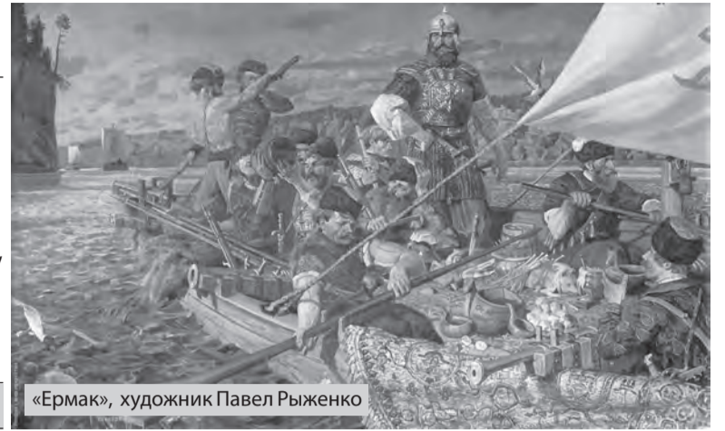
«Ермак», художник Павел Рыженко

Легенда гласит, что рядом с золотоордынской пристанью был когда-то стан отряда Богдана Барбоши. И что здесь он с Ермаком Тимофеевичем и другими атаманами решал вопрос: пойдут ли казаки в услужение царю или останутся вольными людьми.