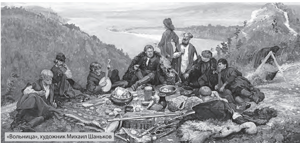
«Вольница», художник Михаил Шаньков