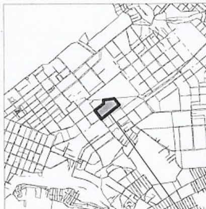
границы испрашиваемой территории

Руководитель Департамента градостроительства городского округа Самара