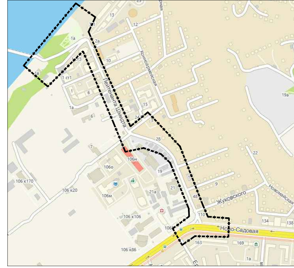
Обзорная схема расположения проектируемого объекта