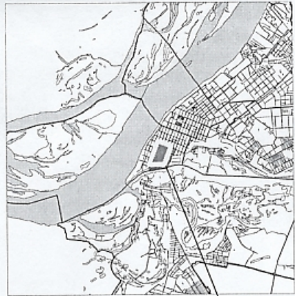
границы испрашиваемой территории