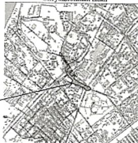
Масштаб 1:15 000