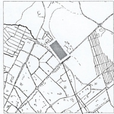
границы запрашиваемой территории