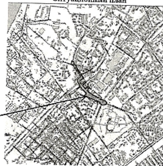
Масштаб 1:15 000