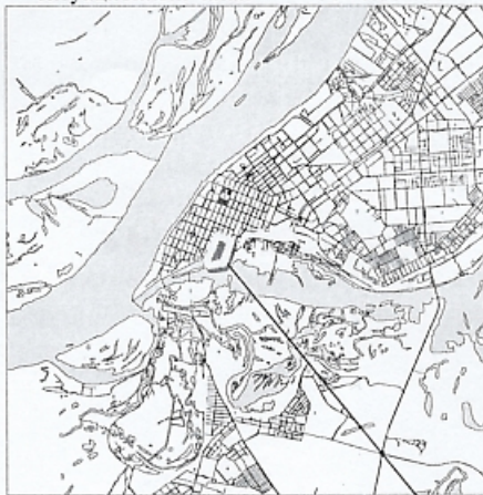
границы испрашиваемой территории

Руководитель Департамента градостроительства городского округа Самара