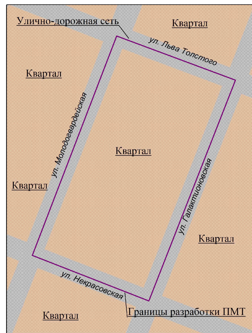
Схема расположения существующих элементов планировочной структуры.