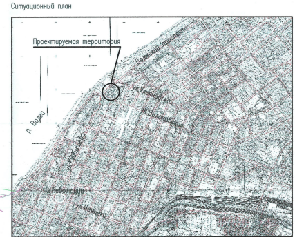
Ведомость жилых и общественных зданий