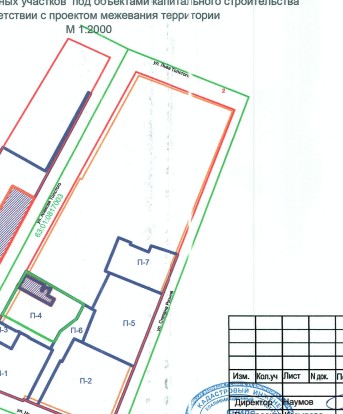
Чертеж границ земельных участков под объектами капитального строительства в соответствии с проектом межевания территории