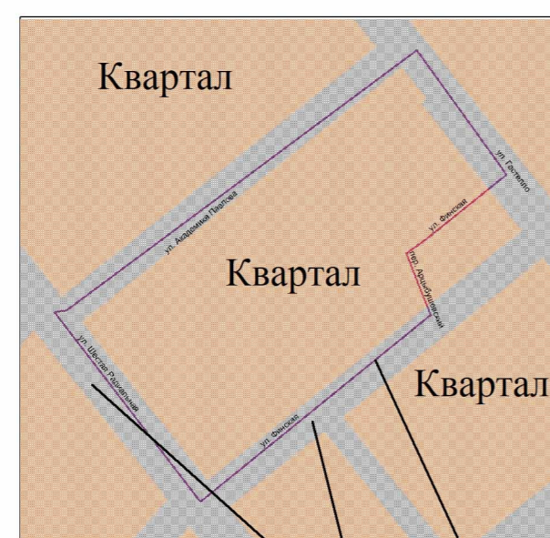
Схема расположения существующих элементов планировочной структуры

Границы разработки проекта межевания территории