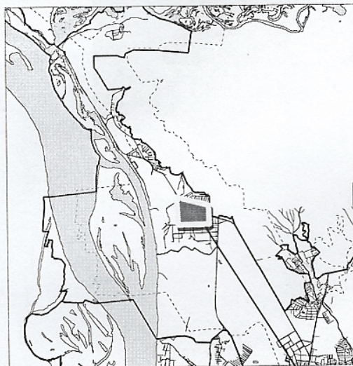
границы испрашиваемой территории