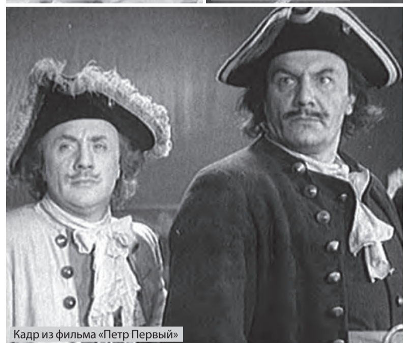
Кадр из фильма «Петр Первый»