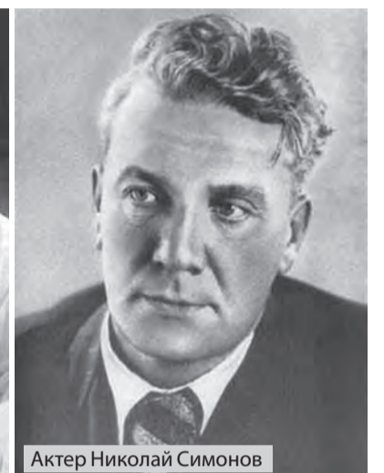
Актер Николай Симонов