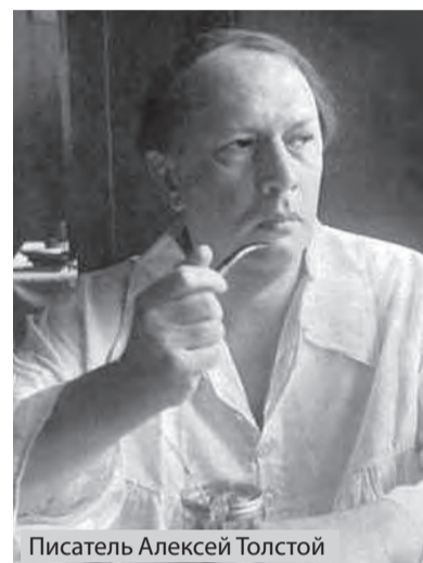
Писатель Алексей Толстой

Симонов имел яркую внешность, привлекавшую внимание зрителя. И напоминал Петра Великого - ростом, мощным телосложением, сильным характером и звучным голосом. Во время съемок фильма Симонов настолько вжился в образ государя, что его до сих пор считают эталонным исполнителем этой роли. Если спросить любого россиянина, как он представляет себе Петра Великого, тот мгновенно обрисует облик самарского актера.