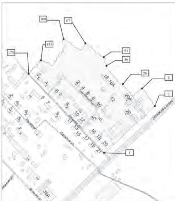
МАСШТАБ 1: 5 000

границ территории для подготовки документации по планировке территории (проекта межевания территории) по внесению изменений в документацию по планировке территории (проект межевания территории, занимаемой многоквартирными жилыми домами в городском округе Самара в границах Московского шоссе, улицы Дальняя и земельного участка с кадастровым номером 63:01:0213001:1435), утвержденную постановлением Администрации городского округа Самара от 29.09.2020 № 784 «Об утверждении документации по планировке территорий (проектов межевания территорий, занимаемых многоквартирными жилыми домами) в городском округе Самара»