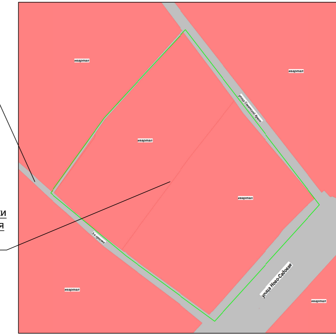
Схема расположения существующих элементов планировочной структуры