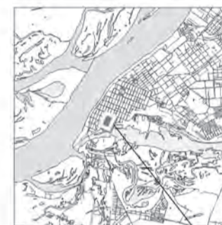
границы испрашиваемой территории

Руководитель Департамента градостроительства городского округа Самара