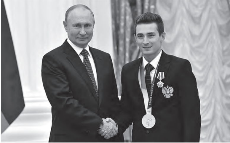
Вручение государственных наград победителям Игр XXXII Олимпиады в Токио

- Во всех смыслах «золотые» чемпионы, вы главные герои и,