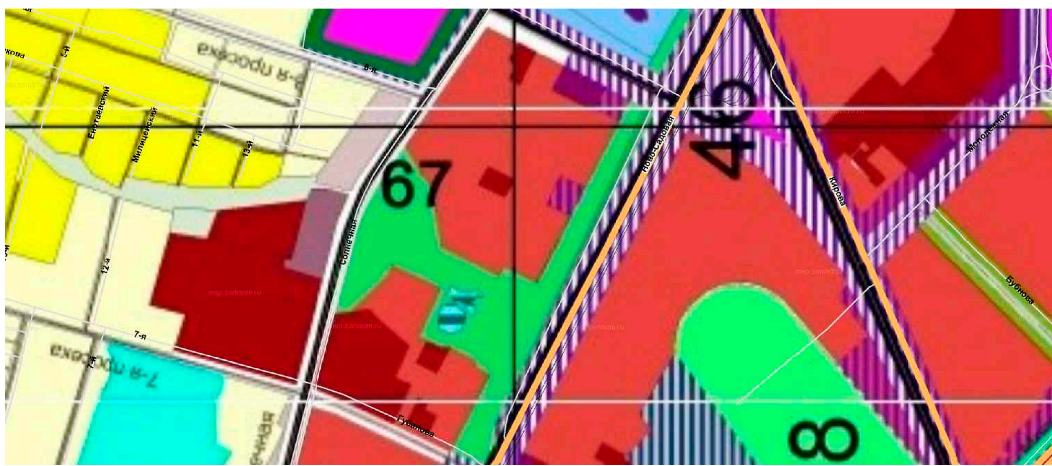
Фрагмент Генерального плана городского округа Самара