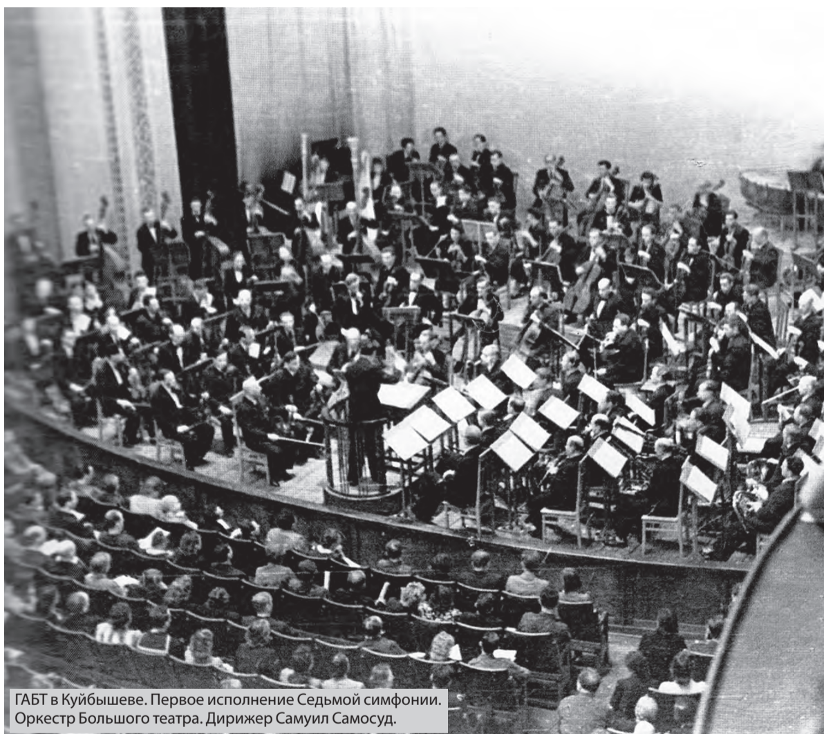
ГАБТ в Куйбышеве. Первое исполнение Седьмой симфонии. Оркестр Большого театра. Дирижер Самуил Самосуд.

В ноябре, когда Самара традиционно вспоминает военный парад первого года Великой Отечественной войны, театр оперы и балета планирует показать на сцене особую премьеру. Это «Ленинградская симфония» Дмитрия Шостаковича (12+). Она станет частью вечера балетов на музыку знаменитого композитора 8 ноября.