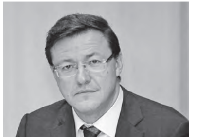
Дмитрий Азаров, ГУБЕРНАТОР САМАРСКОЙ ОБЛАСТИ:

Губернатор подчеркнул, что на территории региона продолжают действовать требования по масочному режиму, социальной дистанции и очень важно соблюдать их, чтобы можно было и впредь обеспечивать полную безопасность работы предприятий, учреждений, проведения важных мероприятий.