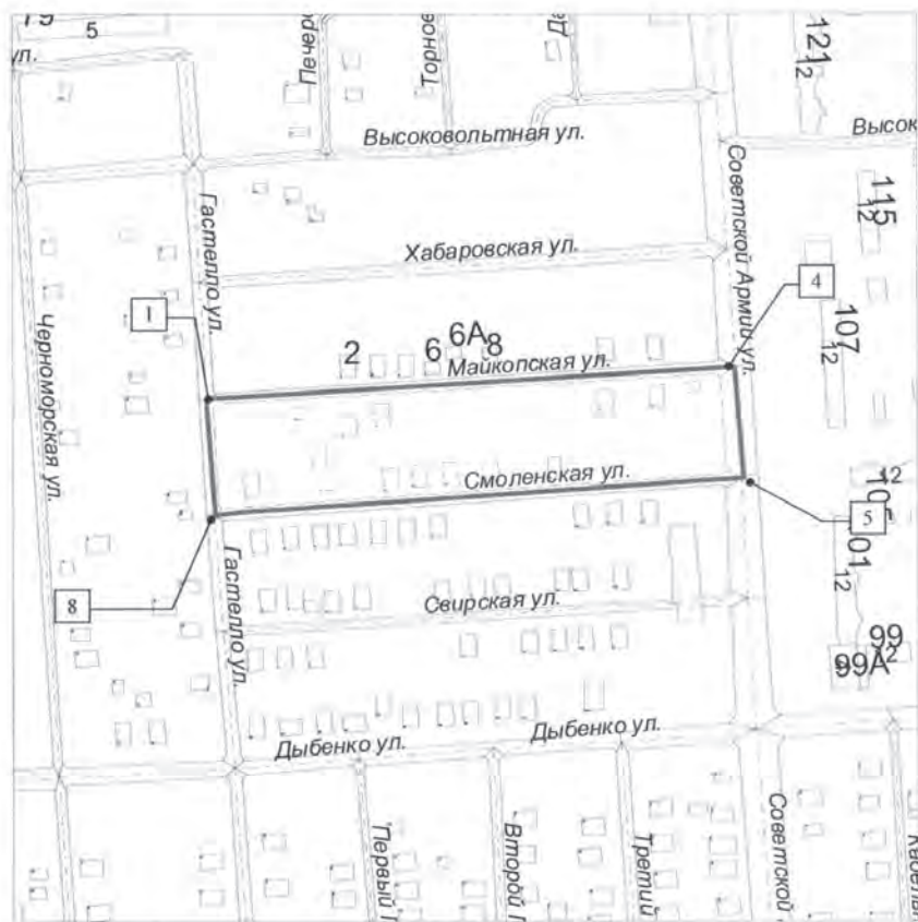
СХЕМА границ территории для подготовки документации по планировке территории (проекта планировки и проекта межевания территории) в границах квартала, ограниченного улицами Майкопской, Советской Армии, Смоленской, Гастелло в Октябрьском районе городского округа Самара