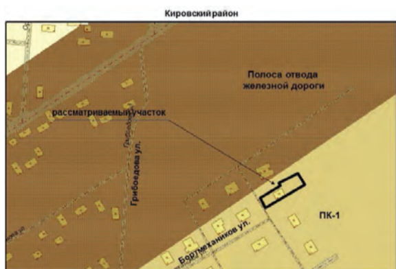
2. Земельный участок площадью 796 кв.м для использования под индивидуальное жилищное строительство по адресу: ул. Бортмехаников, д. 40. Изменение части зоны ПК-1 (зона предприятий и складов V-IV классов вредности (санитарно-защитные зоны – до 100 м) на зону Ж-1 (зона застройки индивидуальными жилыми домами);

Текст и графическая часть п. №2, п. №11, п. №12, п. №13, п. №14, п. №15 в уточненной редакции: