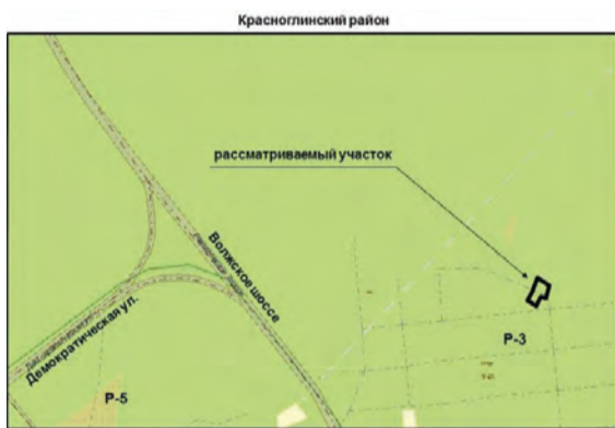
11. Земельный участок площадью 900 кв.м для использования под индивидуальное жилищное строительство по адресу: массив №1, СДТ КНПО «Трул», 1 линия, уч. №7. Изменение части зоны Р-3 (зона природных ландшафтов) на зону Ж-1 (зона застройки индивидуальными жилыми домами);