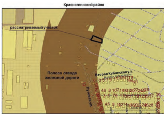
14. Земельный участок площадью 1092 кв.м для использования под ведение садоводства по адресу: Станция Козелковская, СТ «Железнодорожник», массив 18, участок №34, с кадастровым номером 63:01:0335010:514. Изменение части полосы отвода железной дороги на зону Ж-1 (зона застройки индивидуальными жилыми домами);