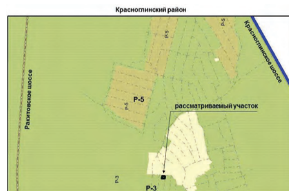
12. Земельный участок площадью 407 кв.м для использования под ведение садоводства по адресу: СНТ «Нижние дойки» массив №3Б, ул. №3, уч. №2. Изменение части зоны Р-3 (зона природных ландшафтов) на зону Ж-1 (зона застройки индивидуальными жилыми домами);