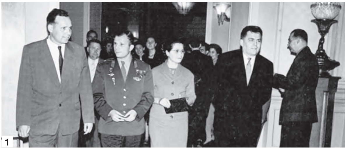
1. Незабываемой на «Прогрессе» стала встреча с Юрием Гагариным.

Почетный авиастроитель страны - о себе, делах производственных и не только