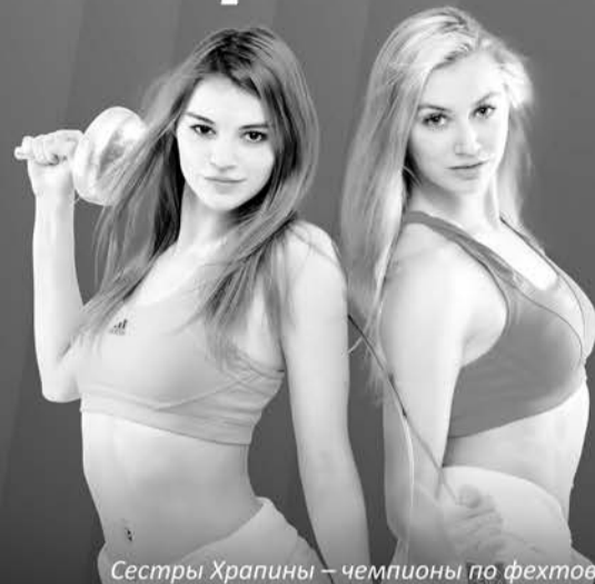
Сестры Храпины – чемпионы по фехтованию