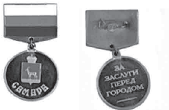
Приложение 4 к Положению «О формах поощрения городского округа Самара»