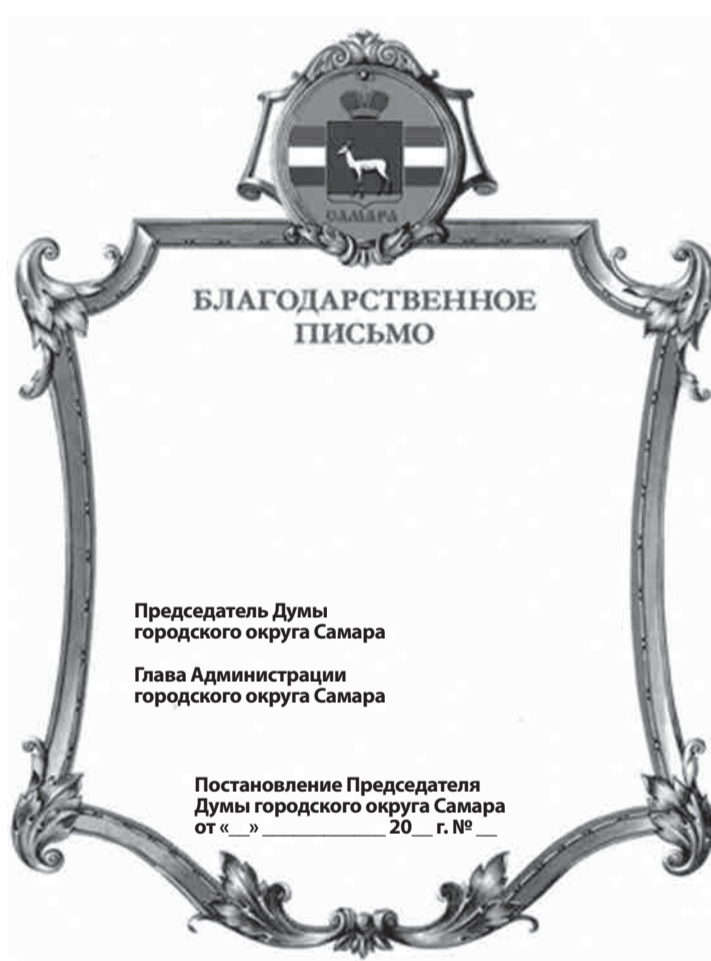
Приложение 7 к Положению «О формах поощрения городского округа Самара»