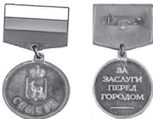
Приложение 5 к Положению «О формах поощрения городского округа Самара»