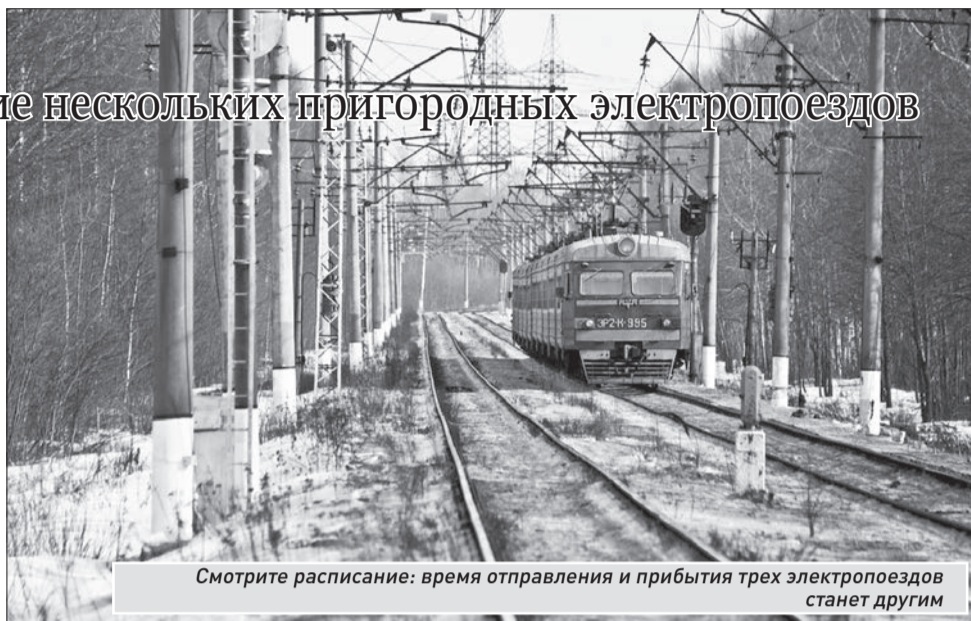
Смотрите расписание: время отправления и прибытия трех электропоездов станет другим

Кроме того, в связи с капитальным ремонтом путей 28, 29, 30 ноября и 1, 5-8 декабря временно будет сокращен маршрут следования электропоездов № 6520 и № 6519. В эти несколько дней конечными пунктами следования электричек будут станции Самара и Толкай, а не Похвист-