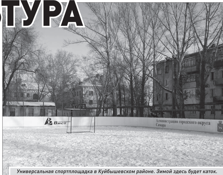
Универсальная спортплощадка в Куйбышевском районе. Зимой здесь будет каток.

За текущий год в общей сложности предполагается посадить 2,3 тысячи деревьев. Сегодня план выполнен на 87%. Количество саженцев крупномеров, попавших в план осенне-зимнего «озеленения», - 407 штук, из которых 293 дерева уже адаптируются к новому месту. Завершение осенне-зимнего «озеленения» намечено на первую неделю декабря.