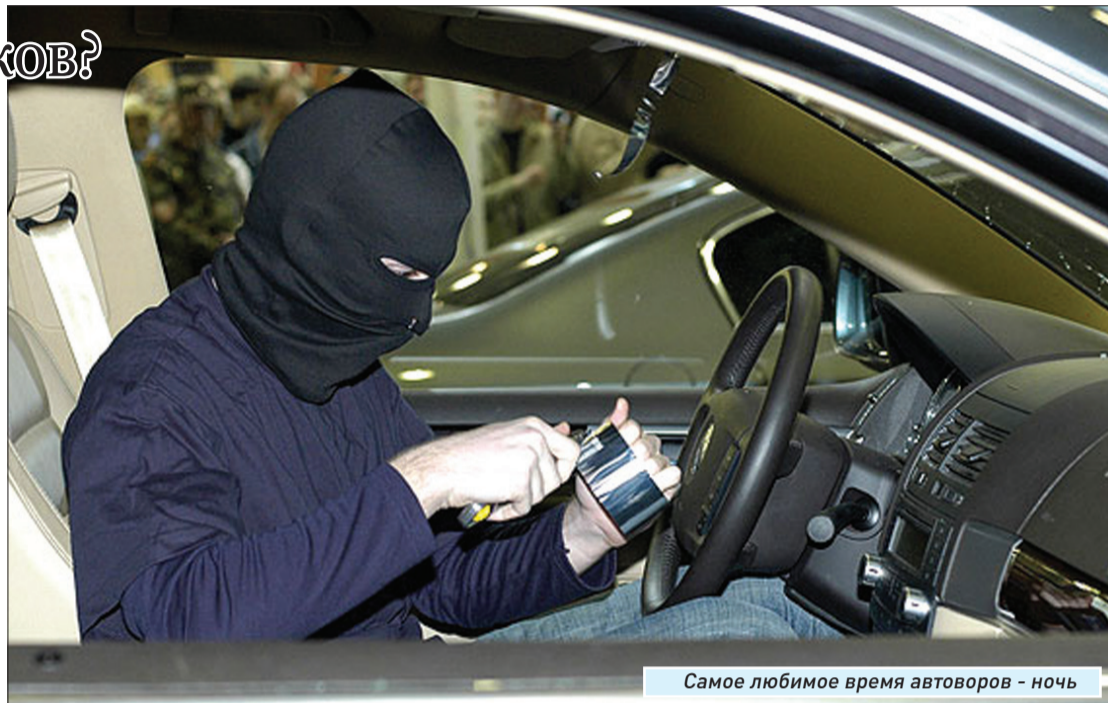
Самое любимое время автоворов – ночь

– Помимо свободных от пробок дорог, у преступников имеются еще преимущества – отсутствие свидетелей и значительная фора во времени.