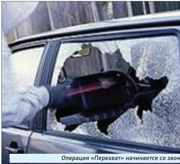
Операция «Перехват» начинается со звонка в полицию

Есть такие злоумышленники, которые специализируются на продаже похищенных машин... их бывшим владельцам. Технология здесь очень проста. После кражи автомобиля угонщики выходят на экс-хозяина и предлагают совершить ему небольшую сделку: получить за некоторый «гонорар», в зависимости от стоимости и состояния, свое авто.