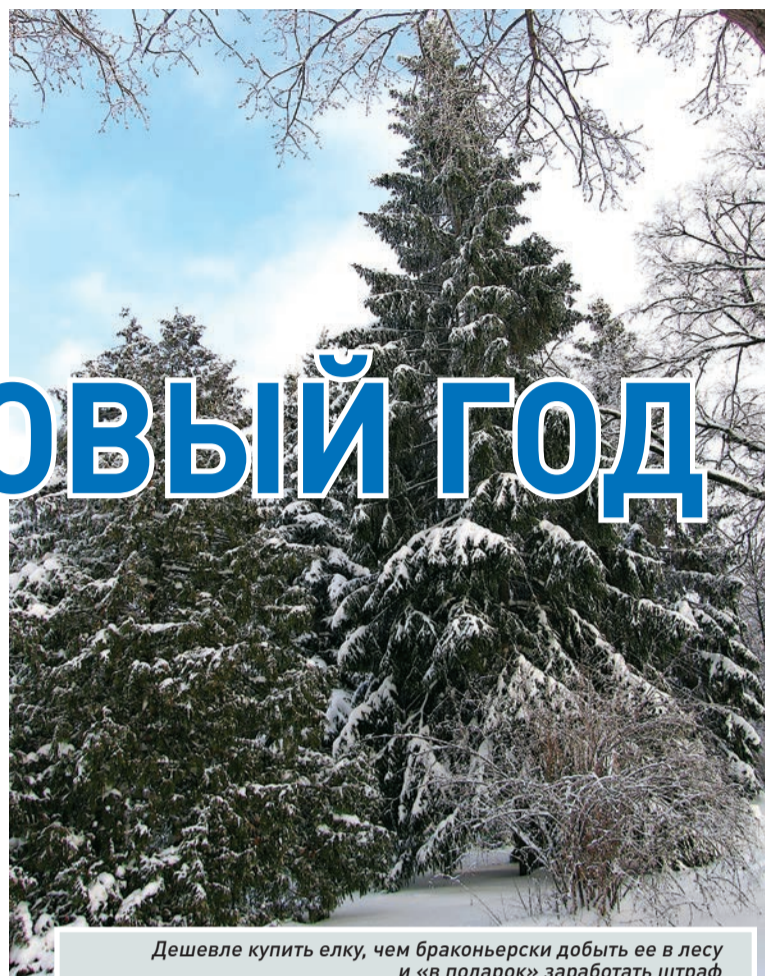
Дешевле купить елку, чем браконьерски добыть ее в лесу и «в подарок» заработать штраф