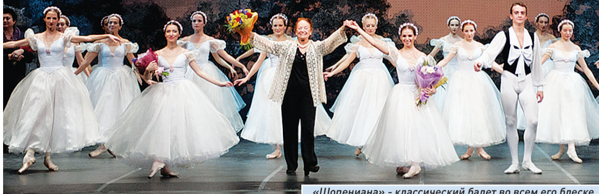
«Шопениана» - классический балет во всем его блеске

Три дня подряд в Самарском театре оперы и балета проходил премьерный показ двух новых постановок, столь различных по стилю, что их можно назвать противоположными по духу.