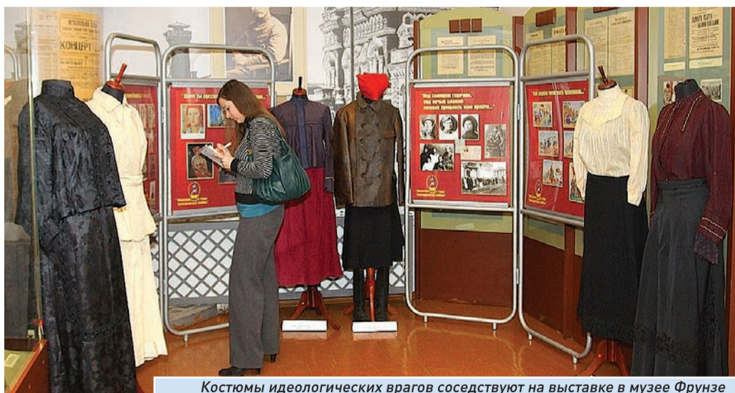
Костюмы идеологических врагов соседствуют на выставке в музее Фрунзе

К 125-летию Самарского областного историко-краеведческого музея им. Алабина в одном из его филиалов – Доме-музее Фрунзе (ул. Фрунзе, 114) – открылась выставка «Женский лик в годы Гражданской войны». Посетители смогут увидеть, как менялась одежда самарчанок с конца XIX века до 20-х годов XX-го. Все экспонаты – подлинные артефакты того времени.