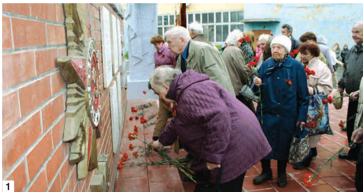
1. Ветераны 4-го ГПЗ - желанные гости на территории завода авиационных подшипников, особенно в День Победы. 2. Памятник работникам 4-го ГПЗ, погибшим в годы Великой Отечественной войны, был отреставрирован и перенесен на территорию нынешнего ОАО «ЕПК», заводчане гордятся им и ласково называют своим Алешей.