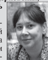
текст — ЯНА ЕМЕЛИНА, Юлия РОЗОВА

— Катя Краснопеева, на мой взгляд, была уникальным ребенком. Как-