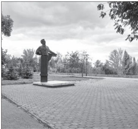
Сквер им. Пушкина благоустроили