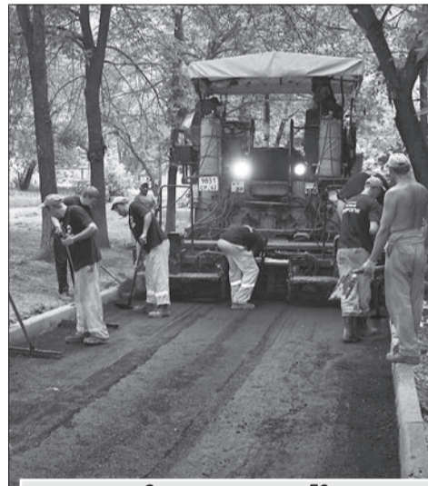
Отремонтировали 59 тыс. кв. м внутриквартальных дорог