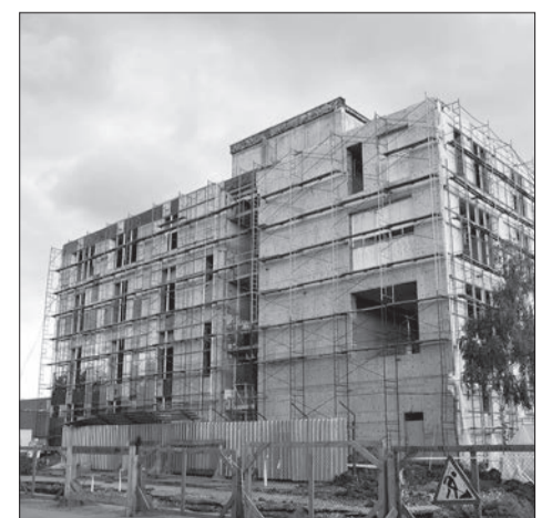
Закончить строительство спортивного комплекса «Динамо» на ул. Аэродромной