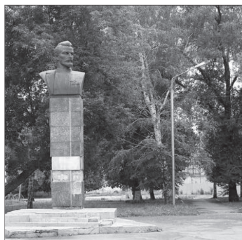
Продолжить благоустройство парка им. Щорса, отреставрировать памятник герою Гражданской войны Николаю Щорсу

Построить новый коллектор ливневой канализации по ул. Авиационной, а также водовод и канализацию в пос. Шмидта.