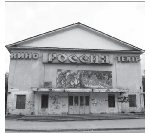
Включили здание к/т «Россия» в список объектов муниципальной собственности, рекомендуемых к передаче по концессионным соглашениям с условием внесения инвестиций в их создание или реконструкцию