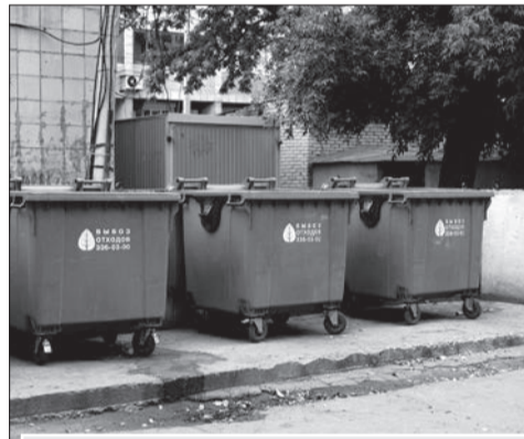
Заменяли 95% старых контейнеров на новые евроконтейнеры с закрывающимися крышками

Довели исправность пожарных гидрантов до 100%. В результате противопожар-