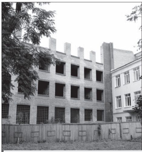
Продолжить признание домов аварийными и их отселение

Демонтировали 71 незаконно установленный объект.