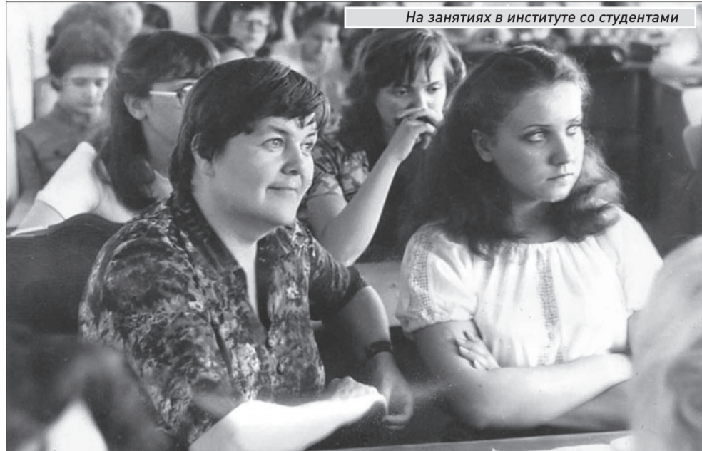
На занятиях в институте со студентами

Сегодня этой умной, тонкой, интеллигентной женщине трижды по 25