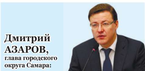
Дмитрий АЗАРОВ, глава городского округа Самара: