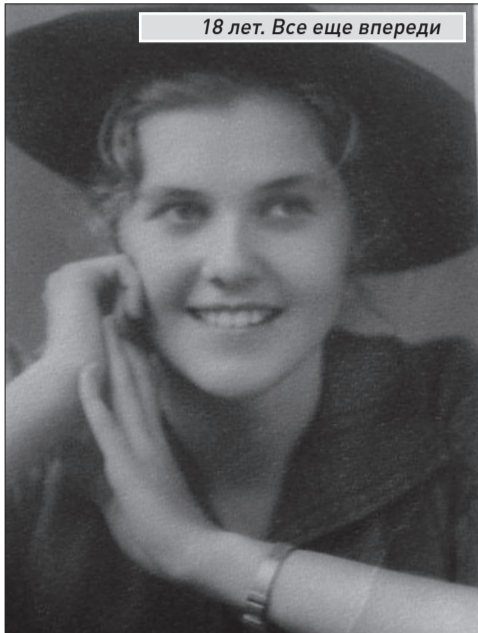
18 лет. Все еще впереди